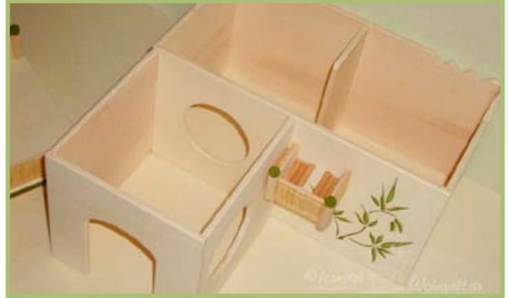
Das Haus hat drei Kammern: eine Toiletten-Kammer, ein Schlafbereich und eine Durchgangskammer