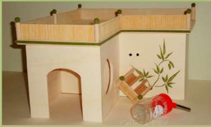
Der Tränkehalter wird direkt am Haus befestigt