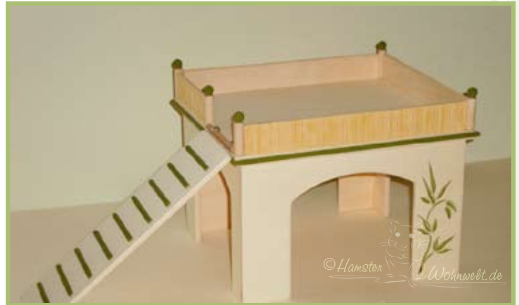
Die Futterbar kann auch im Auslauf als Unterschlupf verwendet werden