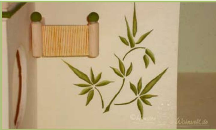
Die Malereien wurden mit ungiftiger Acrylfarbe auf Wasserbasis angebracht