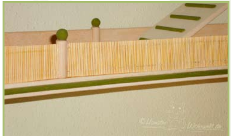
Die Geländer sind mit dünnen Bambus-Stäben verziert, die man oft als Tischsets kaufen kann