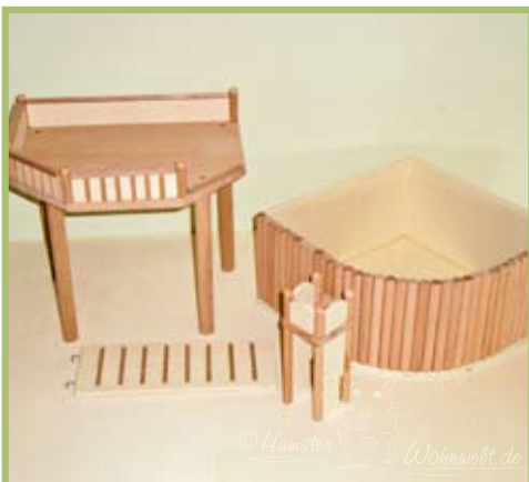
Die Futterbar steht in der Buddelbox