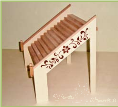
Die Treppe mit gemalten Verzierungen an beiden Seiten