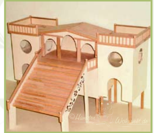
Das Ganze wird einfach zusammengestellt, links und recht werden die beiden Klettertürme platziert.