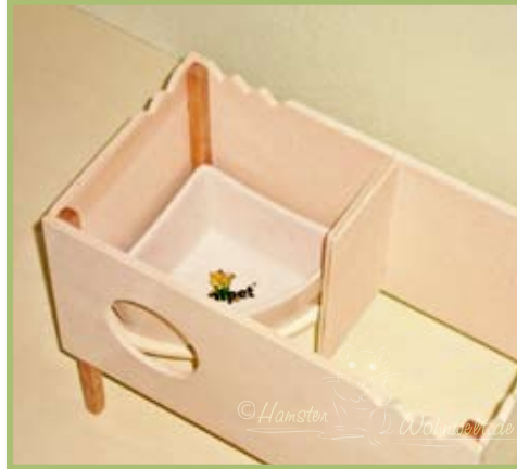
Das Schlafhaus besitzt zwei Kammern: ein Schlafbereich und eine Toilettenkammer mit Unterbuddelschutz-Boden