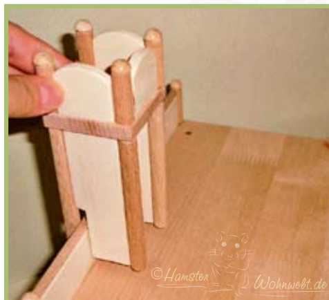
Der Tränkehalter wird dank zwei Einkerbungen an den Stelzen einfach an ein beliebiges Gelände eingehakt.