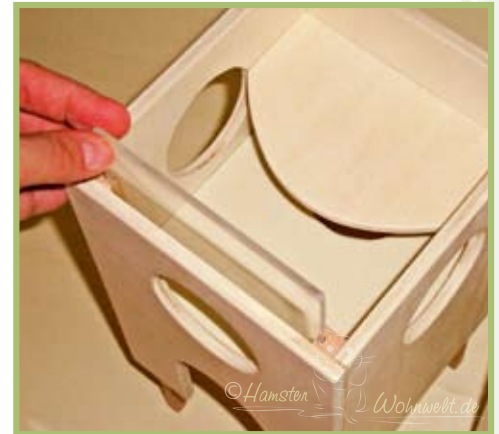
Die Plexiglasscheibe kann mittels zwei U-Profilleisten einfach herausgeschoben werden.