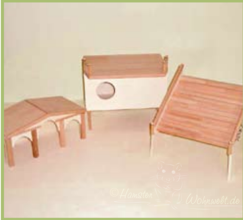
Spielhäuschen, Schlafhaus und große Treppe