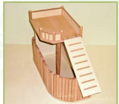
Immer noch genug Platz für eine kleine Abwechslung im Gehege: diese Buddelbox ist gerade mal 16 cm breit – dafür gute 30 cm lang.