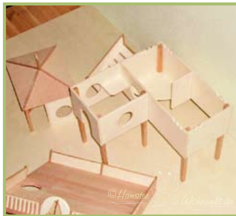
Das Bootshaus besitzt drei Kammern: ein Schlafbereich, eine Toilettenkammer mit Unterbuddelschutz-Boden und eine Durchgangskammer