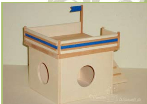
Das Spieltürmchen auf dem Bootshaus-Dach macht sich auch im Auslauf gut als Versteckmöglichkeit