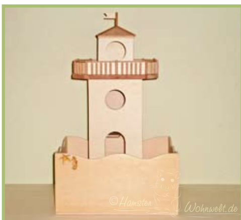
Der Leuchtturm in der Buddelbox