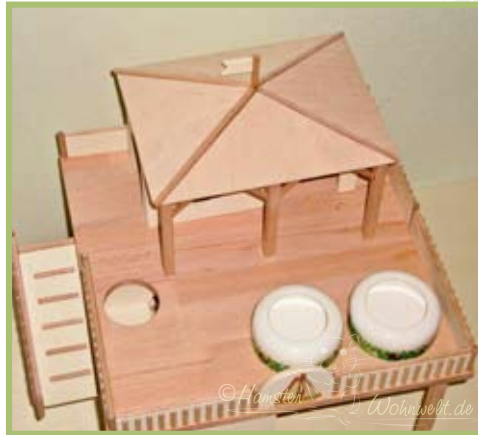
Durchgangsloch auf dem Dach