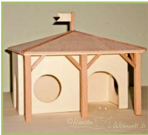
Ideal auch für den Auslauf zum Verstecken und „Hindurchwuseln“