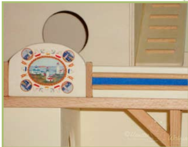
Die Geländerverzierung des Bootshauses