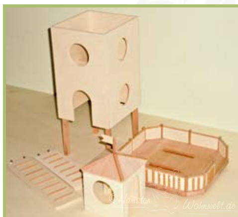
Das Dach ist abnehmbar