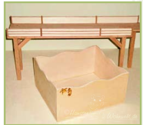
Rennbahn und Buddelbox