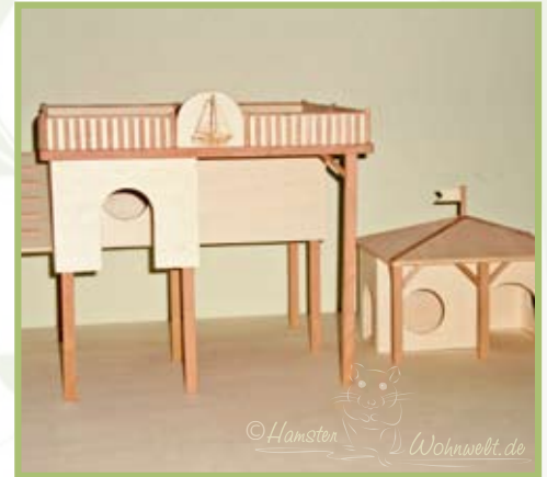
Das Spielhäuschen ist abnehmbar