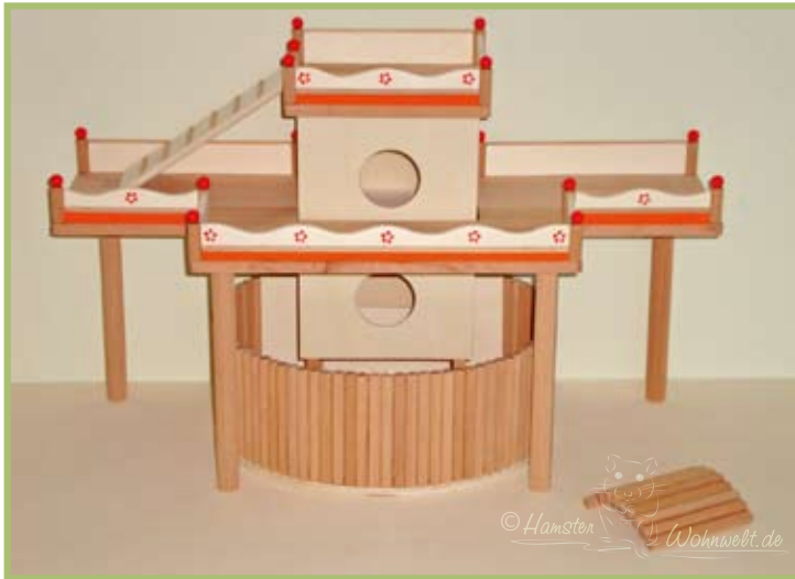
Die Rennbahn führt um den Kletterturm herum