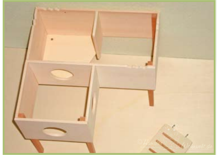
Eine Durchgangskammer, ein Toiletten-Bereich mit Unterbuddelschutz-Boden sowie die Schlafkammer